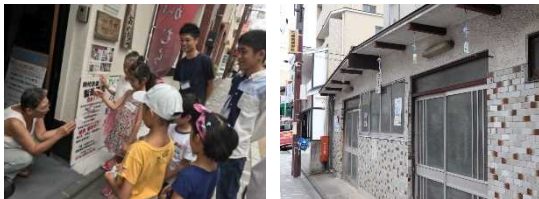
写真：イベント当日の様子