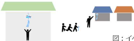
図：イベントのイメージ

第1回イベントとして、風鈴商店街というイベントを実施しました。このイベントは地域の子どもたちがガラスの風鈴に絵を描き、その風鈴を私たちと一緒に中書島繁栄会に飾るというイベントです。