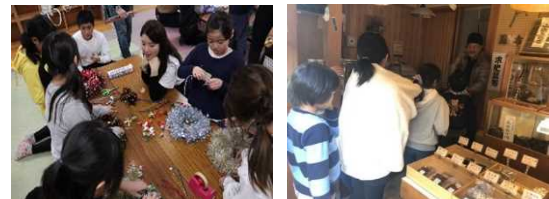
写真：イベント及びプレゼント企画の様子

さらに、このイベントではお菓子プレゼント企画を実施しました。事前にお菓子をもらえる引換券を配布します。当日その引換券を持った子どもたちが繁栄会のお店に行くと、お菓子がもらえるという企画です。店主と子どもたちの直接的な関わりを作ります。